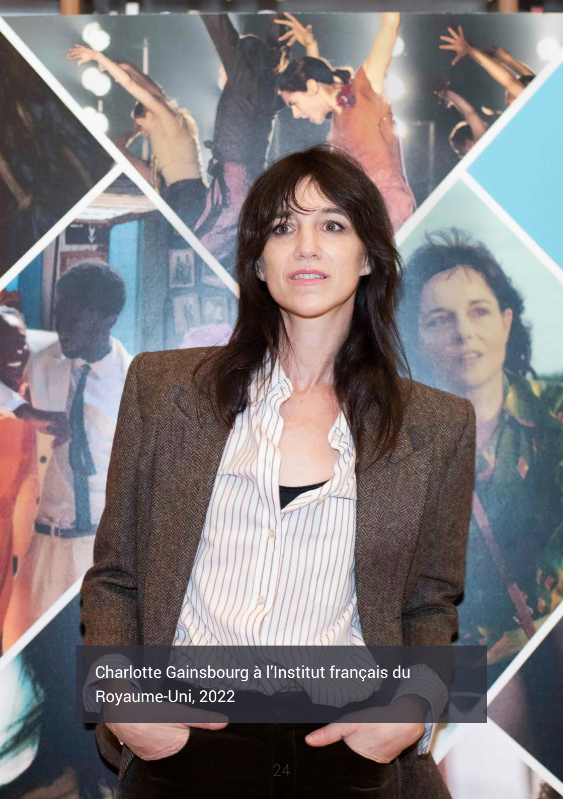
Charlotte Gainsbourg à l'Institut français du Royaume-Uni, 2022