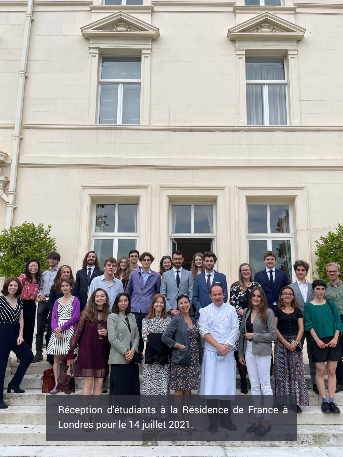
Réception d'étudiants à la Résidence de France à Londres pour le 14 juillet 2021.