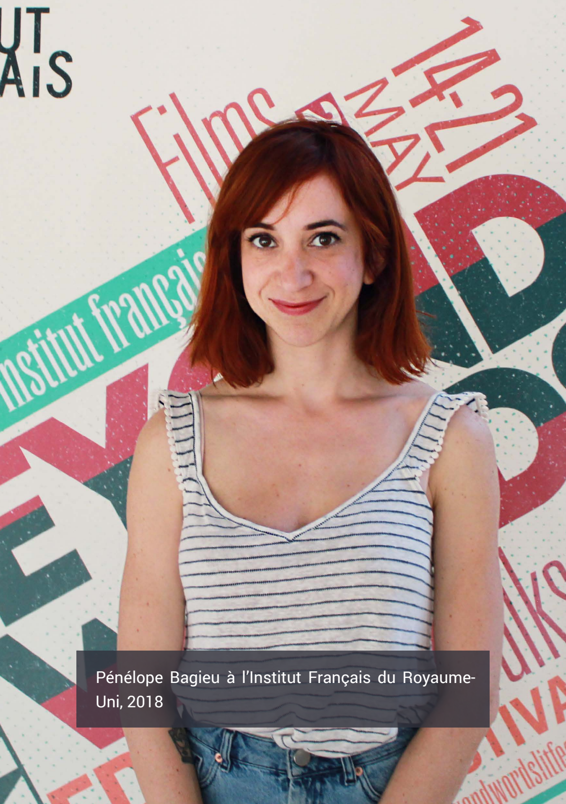
Pénélope Bagieu à l'Institut Français du Royaume-Uni, 2018